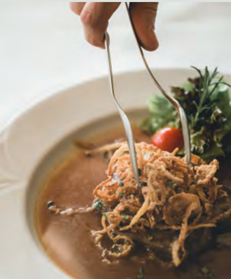
Gönnen Sie sich einen herzhaften Genuss: Unseren saftigen Zwiebelrostbraten