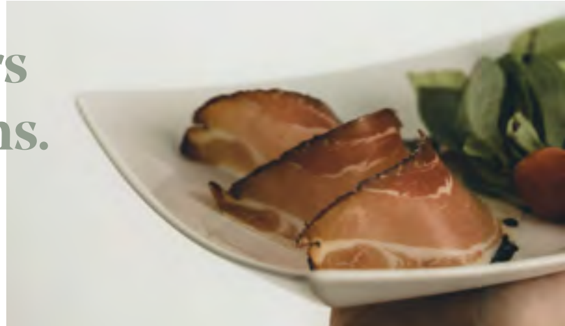
Der hausgemachte Schinken aus der Räucherammer.

Das mit der Kulinarik und dem Kochen wurde uns bereits in die Wiege gelegt. Unsere Großmutter hat uns viele Rezepte hinterlassen, die wir mit viel Liebe zum Detail und mit hochwertigen Zutaten seit Generationen weitergeben. Im Landhotel Waldeck sind wir stolz auf unsere kulinarischen Traditionen und auf die handwerkliche Herstellung dieser Spezialitäten. Das Ergebnis sind hausgemachte Marmeladen in verschiedenen Geschmacksrichtungen, die Sie zum Frühstück auf unseren duftenden Brotvarianten genießen können. Für Honigliebhaber bieten