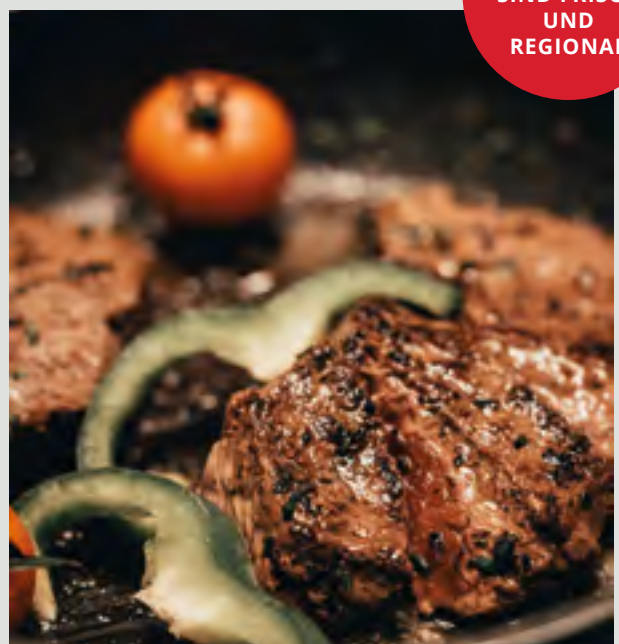
Feurige Perfektion auf dem Teller: Saftiges Steak, scharf angebraten, begleitet von Paprika, Zwiebeln und köstlichem Gemüse.

UNSERE LEBENSMITTEL SIND FRISCH UND REGIONAL