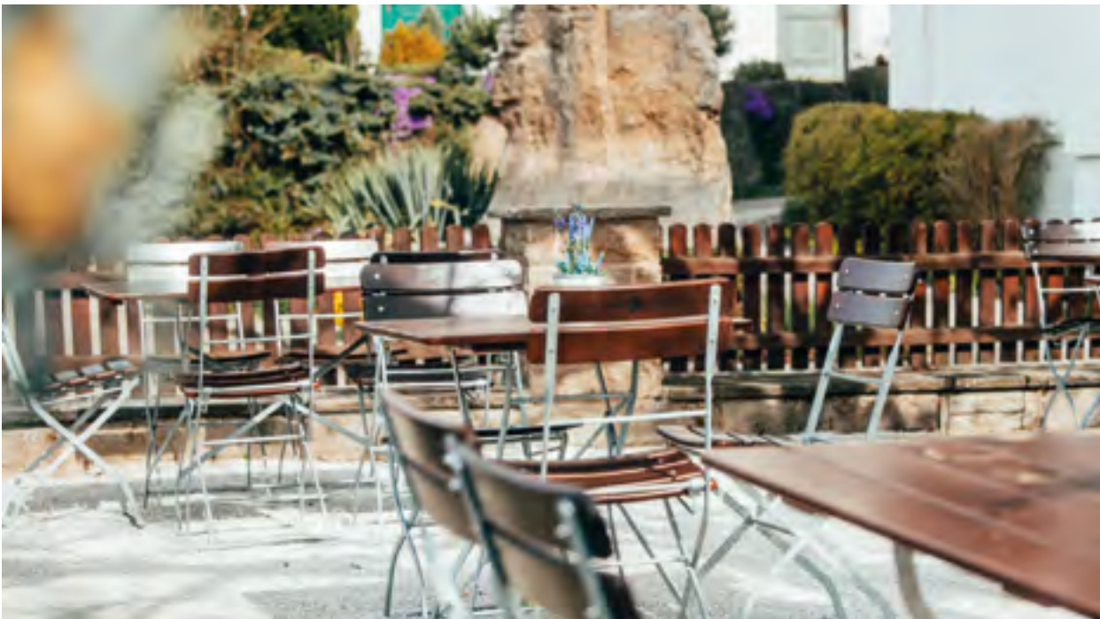
Genießen Sie unsere Gerichte bei Sonnenschein in unserem Biergarten.